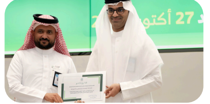
الإدارة العامة للتشغيل والصيانة