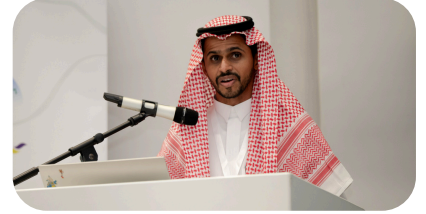
فريق كفاءة الطاقة