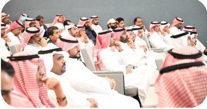
الإدارة العامة للإتصال والإعلام