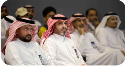
كلية الفنون والعلوم الإنسانية