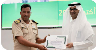
الإدارة العامة للسلامة والأمن الجامعي